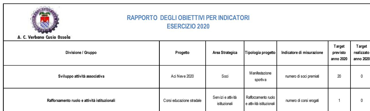
Tabella 6.4.3 – Piano obiettivi per indicatori

I target fissati per i due progetti non sono stati raggiunti per l'impossibilità di svolgere le attività in questione.